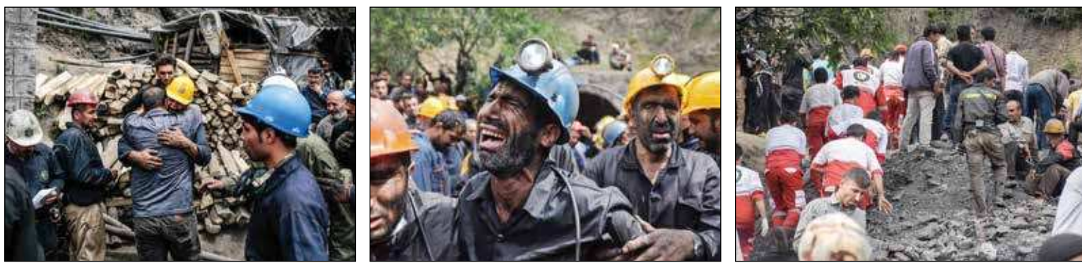
گزارش میدانی آفتاب یزد از معدن «زمستان یورت آزادشهر» استان گلستان بیست و پنج ماه و یک روز بعد از حادثه