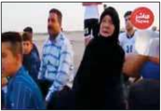
به نوجوانان برای موفقیت در بازی راهکارهایی ارائه می‌دهد و بر اتحاد میان بازیکنان تاکید دارد.

گزارشی کوتاه و جالب را از نظر می‌گذرانید که زن سالخورده عرب زبانی را به عنوان یار دوازدهم تیم فوتبالی در اهواز به تصویر می‌کشند. به گزارش باشگاه خبرنگاران، مادربزرگی عرب زبان در اهواز یار دوازدهم تیم فوتبال محله‌اش شده است. یکی از بازیکنان جوان این تیم دربارۀ زن فوتبالی دوست سالخورده می‌گوید: از وقتی او به جمع ما آمده است انگار دنیا را به ما داده‌اند زیرا تا رسیدن به برد در بازی، ما را با روحیه خود یاری می‌کند. این مادربزرگ علاقه‌مند به فوتبال