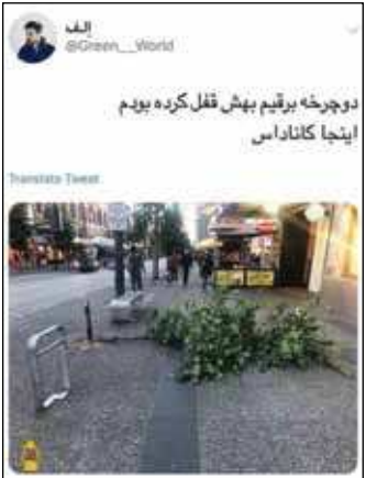
قطع کرده است. در متن این پست آمده است: «دوچرخه برقیم بهیچ قفل کرده بودم، اینجا کاناداس»

به تازگی یکی از کاربران فضای مجازی در صفحه توئیتر خود تصویری از یک اتفاق عجیب در کشور کانادا منتشر کرده که بازخوردهای بسیاری داشته است. به گزارش باشگاه خبرنگاران، مدت‌هاست که ایران با کشورهای اروپایی و آمریکایی در بسیاری از مسائل مقایسه می‌شود. در پیشرفته بودن بعضی کشورهای غربی شکی نیست اما این نباید دلیلی بر نادیده گرفتن نقاط ضعف آن‌ها و فراموشی نقاط مثبت کشور ما باشد. به تازگی توئیتر در فضای مجازی منتشر شده است که در آن یکی از کاربران تصویری را به اشتراک گذاشته که تعجب بسیاری را برانگیخته است. با توجه به تصویر و متنی که برای آن نوشته شده است، فردی دوچرخه برقی خود را به درخت قفل کرده بوده است. دزد هم که تنها راه برای دزدیدن این دوچرخه را خلاص شدن از شر درخت می‌دید آن را